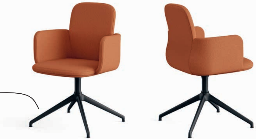
Alu-Vierfuß schwarz matt Piétement 4 branches, noir mat