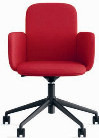
Konferenz Partner Siège conférence