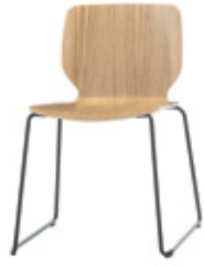
Rod sled chair with wooden shell Silla varilla con carcasa de madera Chaise baguette coque bois