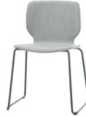
Rod sled chair with upholstered shell Silla varilla con carcasa tapizada Chaise baguette coque tapissé