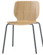
Four leg chair with wooden shell Silla de cuatro patas con carcasa de madera Chaise 4 pieds coque bois