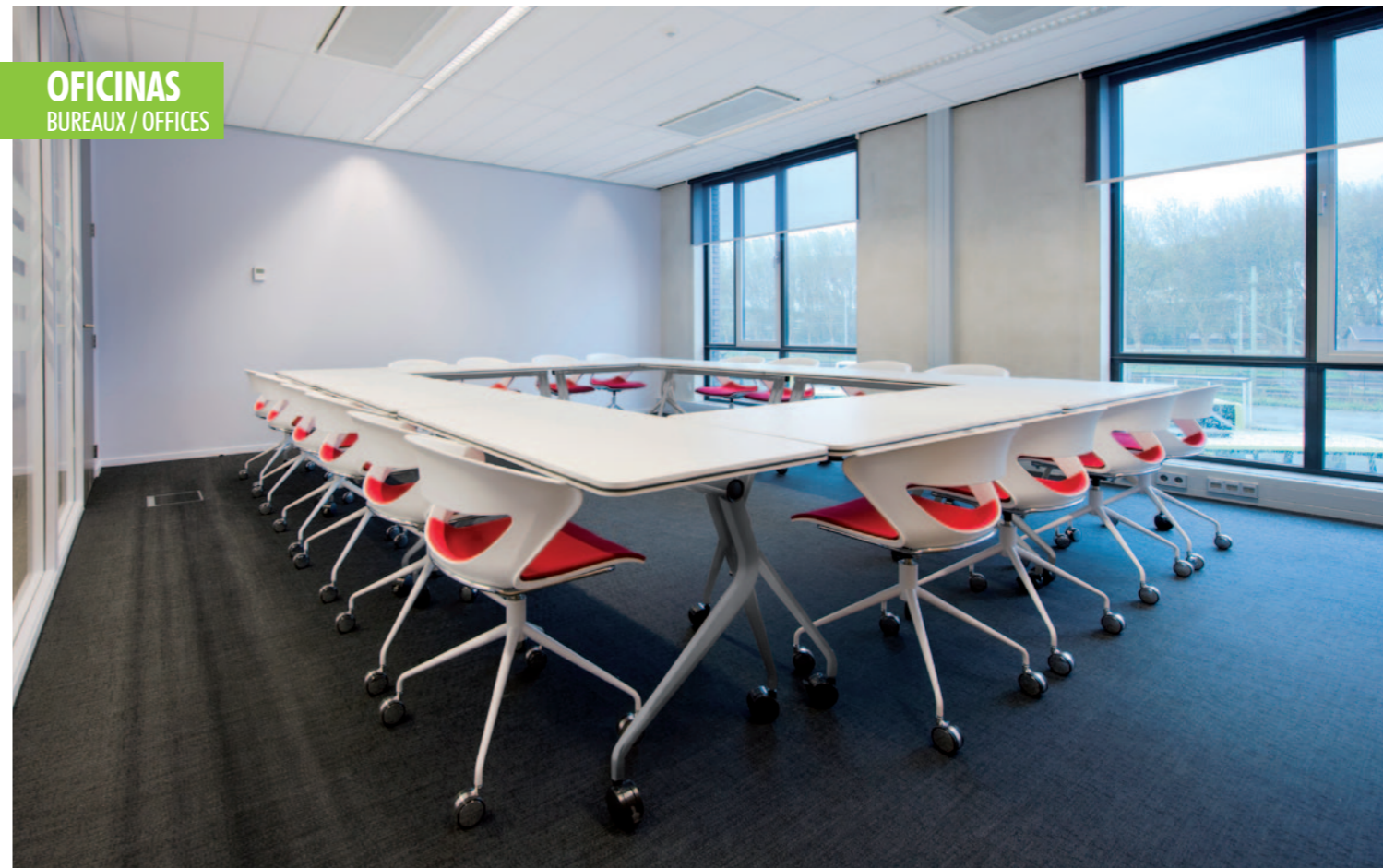
OFICINAS BUREAUX / OFFICES