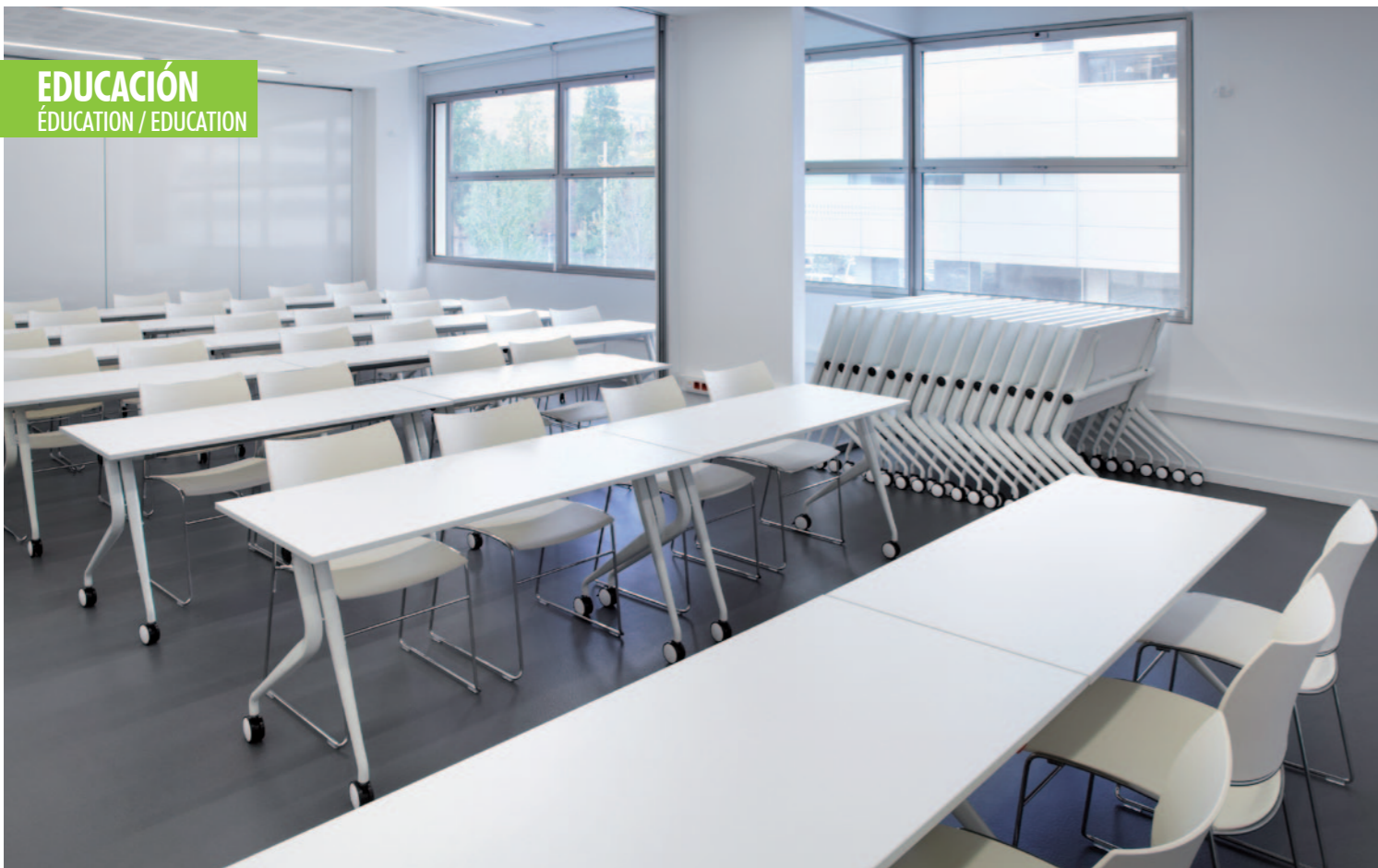
EDUCACIÓN ÉDUCATION / EDUCATION