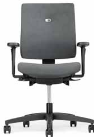
111.0000 + al055-02