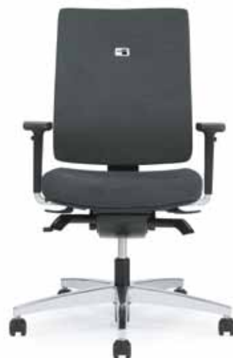
112.0000 + fk100-14 + al048-01