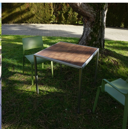
Table 4 pieds...