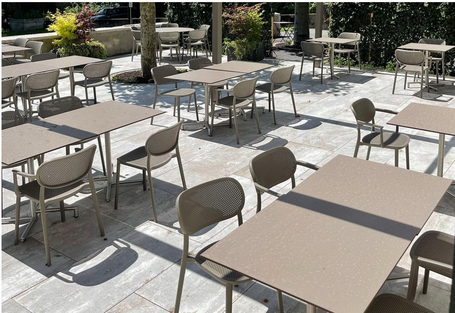
Table pour l'extérieur, utilisation en été comme en hiver

Conseils d'aménagement et réalisation de projet